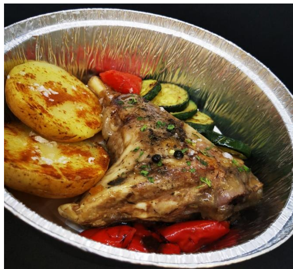
Codillo de cordero confitado con bayas de pimienta y guarnición (foto) 17,95€

En diciembre cerramos los días: 16, 21, 25, 28 y en Enero: 1, 4, 13, 20 y 27