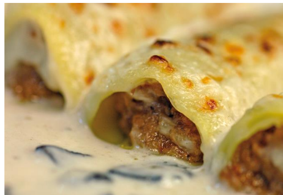
Canelones de Carne 2'05€/ unidad € (min. 3)