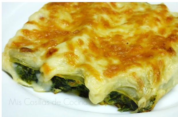
Canelones de espinacas 1'95€ / unidad (min. 3)